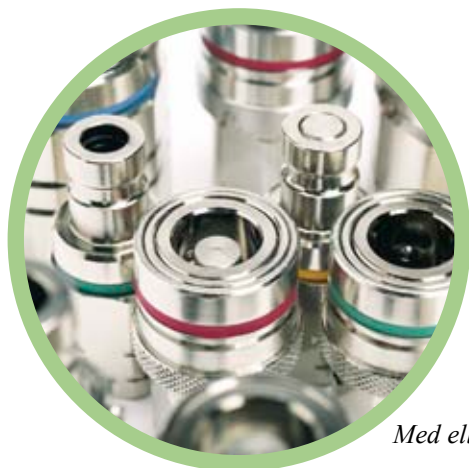
Med eller uden ventil

Væske serien leveres i udgaver med koblinger og nipler, med eller uden ventil. Udgaver med ventil i både kobling og nippel er en-håndsbetjente, og er den mest anvendte kombination i væske applikationer. Grundet konstruktionen, er koblinger uden ventil to-håndsbetjente ved ind og udkobling, og er anvendelige hvor spild af væske ved ind og udkobling ikke udgør nogen risiko.