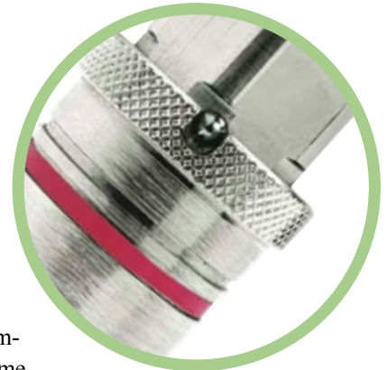
Type med sikkerhedslås